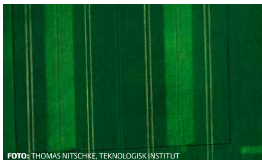
Dronefoto optaget 4. juni fra forsøget med gulrust i Benchmark i tabel 28. De ubehandlede områder med gulrust ses tydeligt. I forsøget blev der opnået et sikkert merudbytte på 2,5 hkg pr. ha for at graduere dosis af svampemidler efter biomasse.

ning af tildelingskort til graderet tildeling af svampemidler i de enkelte parceller. Forsøgene er høstet med flowmåling og højpræcist GPS-udstyr. Høstudbyttets georefereres punktvis som delmålinger i de enkelte parceller, hvilket muliggør en geostatistisk analyse af udbyttet. Den geostatistiske analyse er udført af Teknologisk Institut og muliggør en analyse af sammenhængen mellem biomassemåling, svamperegistrering og punktvis høstudbytter i parcellerne.