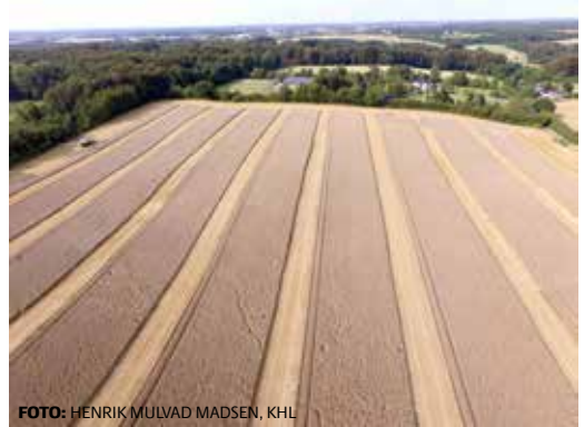
Foto fra forsøg 013 i tabel 27 med gradueret tildeling af svampemidler.

Forsøgene er tilstræbt anlagt i marker med relativ stor variation, men ikke med unaturlig stor variation. Forsøgene er anlagt på bedrifter med udstyr til gradueret sprøjtning og udbyttmåler på mejetærsker eller bedrifter med brovægt. Forsøgene er høstet med landmandens mejetærsker.